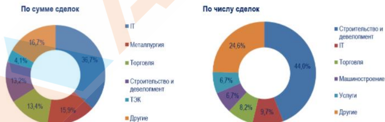
Рисунок 4.5. Удельный вес отраслей на российском рынке M&A в I квартале 2021 года